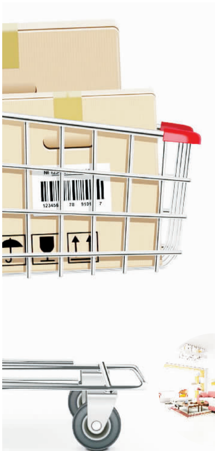
商品零售总额主要数据一览

2016年零售业销售呈良好态势。国家统计局公布的数据显示,2016年7月,社会消费品零售总额26827亿元,同比增长10.2%,商品零售达23944亿元,增长10.1%,约占7月社会消费品零售总额的89.3%。其中,家用电器和音像器材、家具、建筑及装潢材料、化妆品、汽车等零售同比大幅增长。什么原因让上述商品在这个夏天大卖?哪些商品是北京消费者的最爱?