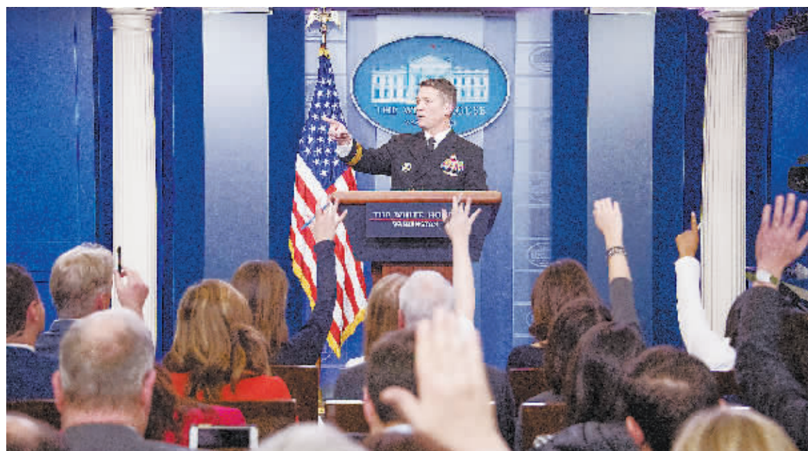
16日,美国华盛顿,美国白宫医生宣布特朗普的身体状况适合担当总统。

当地时间16日,美国白宫医生宣布,特朗普的身体状况适合担当总统。罗尼·杰克逊医生在白宫举行的一次不寻常的发布会上告诉记者,总统的整体健康状况非常好。他补充说,特朗普很容易通过了旨在测试他精神状态的认知评估。