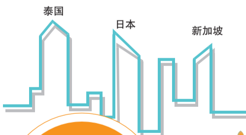
春节出境游人气排行前三位

另外,长线旅游也越发受到青睐,美国作为出境目的地进入了前十位,北欧、迪拜阿联酋、欧洲、新西兰等长线目的地热度增长迅猛。从高端旅游周刊联合《数据》杂志所推出的调查数据显示,选择7-9天出境游计划天数的占据29%,选择10天及10天以上的占据24%,显然游客希望花费更长时间去体验境外旅游目的地。