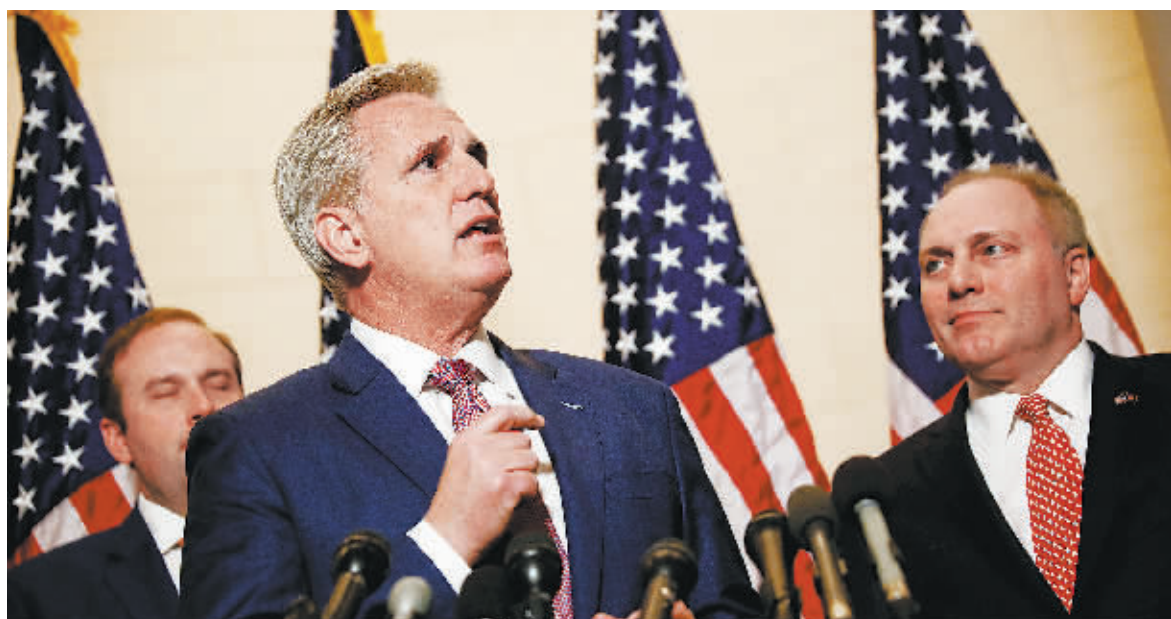
14日,在美国华盛顿国会山,凯文·麦卡锡(前)在记者会上讲话。