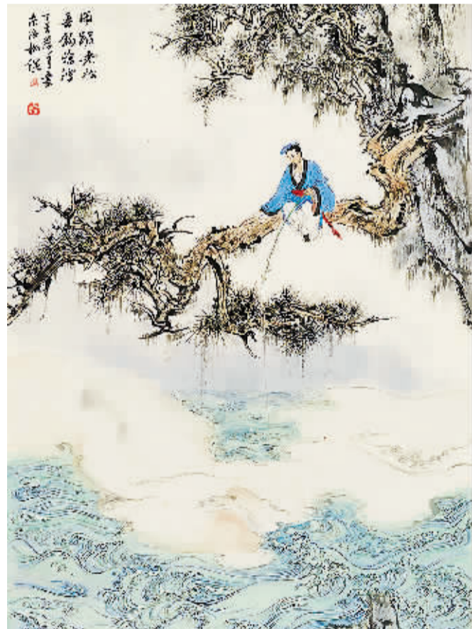
《闲踞老松 垂钓沧溪》