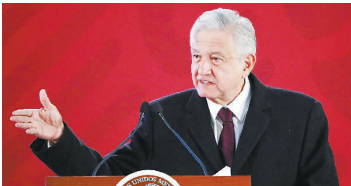
9日,墨西哥总统奥夫拉多尔发声称,他不会参与讨论美国总统特朗普关于边境墙一事。CFP/图

当地时间9日,墨西哥总统奥夫拉多尔发声称,他不会参与讨论美国总统特朗普关于边境墙一事,并称“这是美国内部的政治议题”。据俄罗斯卫星通讯社报道,早前,特朗普曾表示,根据重新谈判的北美自由贸易协定,墨西哥将提供修建边境墙的资金,然而,墨西哥从未确认自己将支付该笔款项。