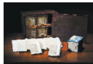
陈鉴辑《石壁精舍音注唐书细节》