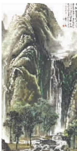
李可染《千岩竞秀万壑争流图》