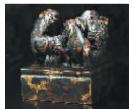
铜点金异兽钮“乾隆御览之宝”